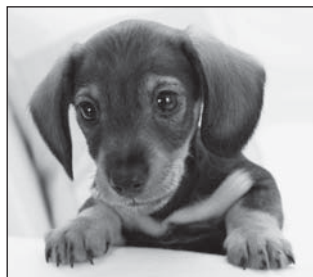
Ilustrační foto, zdroj: http://wallpaper.wallpedia.org

Více informací a podrobnosti o soutěži najdete na webových stránkách www.misspes.cz , kde postupně budeme zveřejňovat i fotografie jednotlivých soutěžících.