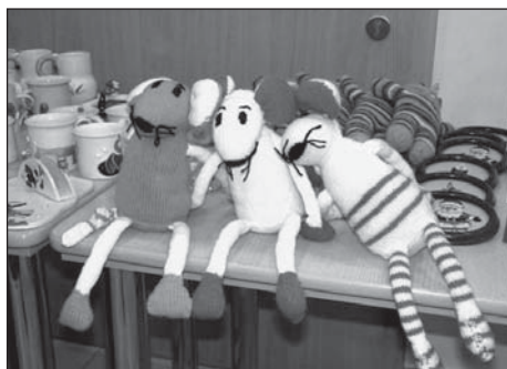
Kouzelné vánoční drobnosti vytvořili přátelé, pedagogové a žáci Múzické školy a členky občanského sdružení Noema.

Jarmark pořádalo občanské sdružení Noema , které spojuje rodiče a přátele Múzické školy a jehož základním cílem je podpora této školy a jejich žáků.